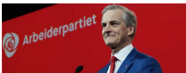
Statsminister Jonas Gahr Støre.

De fleste sakene som blir behandlet på Stortinget kommer fra regjeringen, f.eks. de fleste lovene. Regjeringen lager også forslag til statsbudsjett.