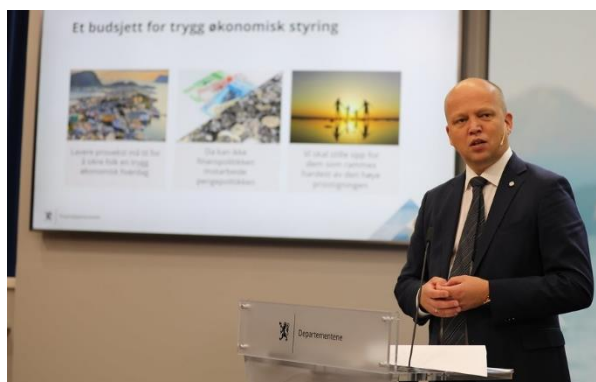
Finansminister Trygve Slagsvold Vedum presenterer statsbudsjettet.