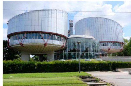
Den europeiske menneskerettighetsdomstolen (EMD) i Strasbourg.

Teksten bygger på en artikkel med samme tittel fra ung.no, men er forkortet og forenklet for å passe til målgruppen voksne andrespråksinnlærere på nivå A2: