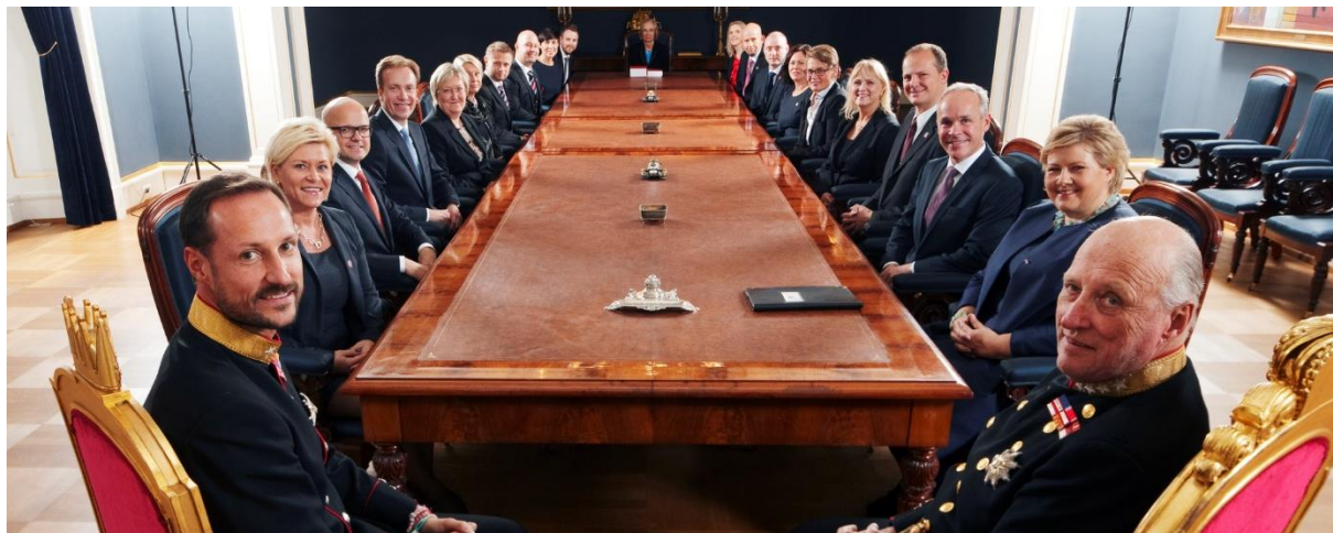
Regjeringen Solberg i statsråd på slottet.

Regjeringen har ansvaret for å gjennomføre de vedtakene som Stortinget bestemmer. Derfor kalles regjeringen den utøvende makt.