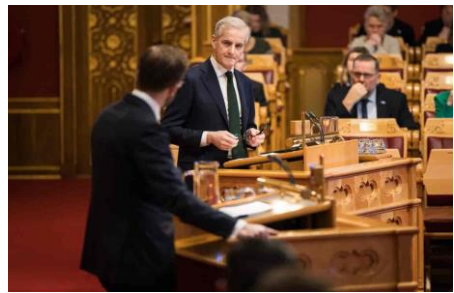
Muntlig spørretime i Stortinget.

Du kan være til stede på Stortinget som tilhører når politiske spørsmål debatteres. En av de mest populære debattene er muntlig spørretime. I spørretimen kan representantene stille spørsmål direkte til statsrådene, eller ta opp nye saker.