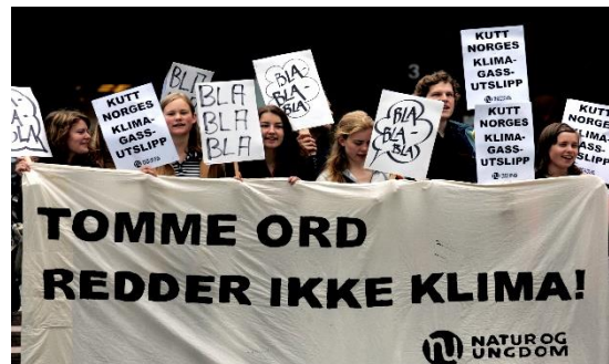
Demonstrasjon for klimaet.

En måte å si ifra at man er uenige i noe, er å arrangere eller delta i demonstrasjoner. I politiske demonstrasjoner kan du vise politikerne hva du mener om en sak.