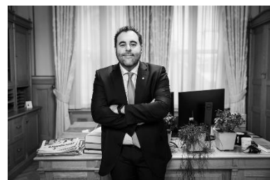
Storingspresident Masud Gharakhani.

Storingspresident: Etter stortingsvalget velger representantene i Stortinget stortingspresident. Storingspresidentene leder diskusjonene i Stortinget.