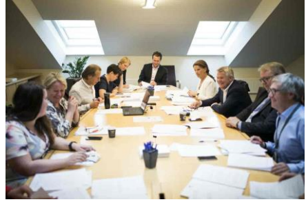
Fra et møte i justiskomiteen.

Representantene på Stortinget kommer fra ulike politiske partier. Representanter fra samme politiske parti samler seg i partigrupper. Partigruppene ledes av en person som kalles parlamentarisk leder.