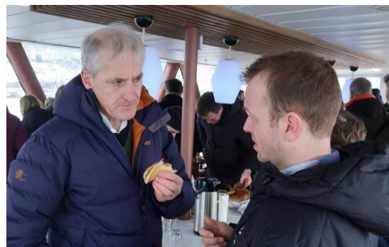
I samtale med statsministeren.

En viktig del av politikernes jobb er å snakke med folk. For å påvirke politikere kan du ta kontakt med dem og fortelle hva du mener om en sak.